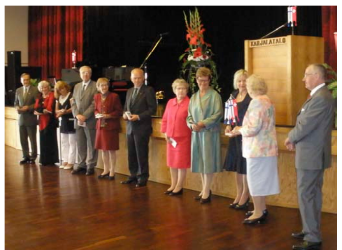
Juhlassa palkittujen henkilöiden rivistö

Monet paikallisosastomme ovat melko hiljaisia. Pääkaupunkiseutu, Turku ja Sveitsin Ystävien Kilta Tampereel-