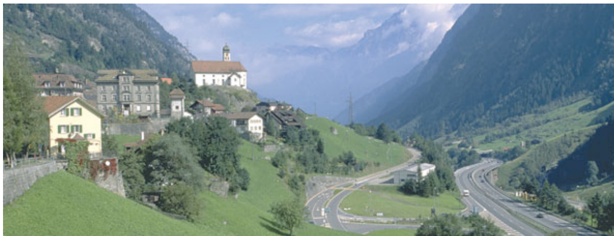
kuva: Wassen , Tourist Info Uri